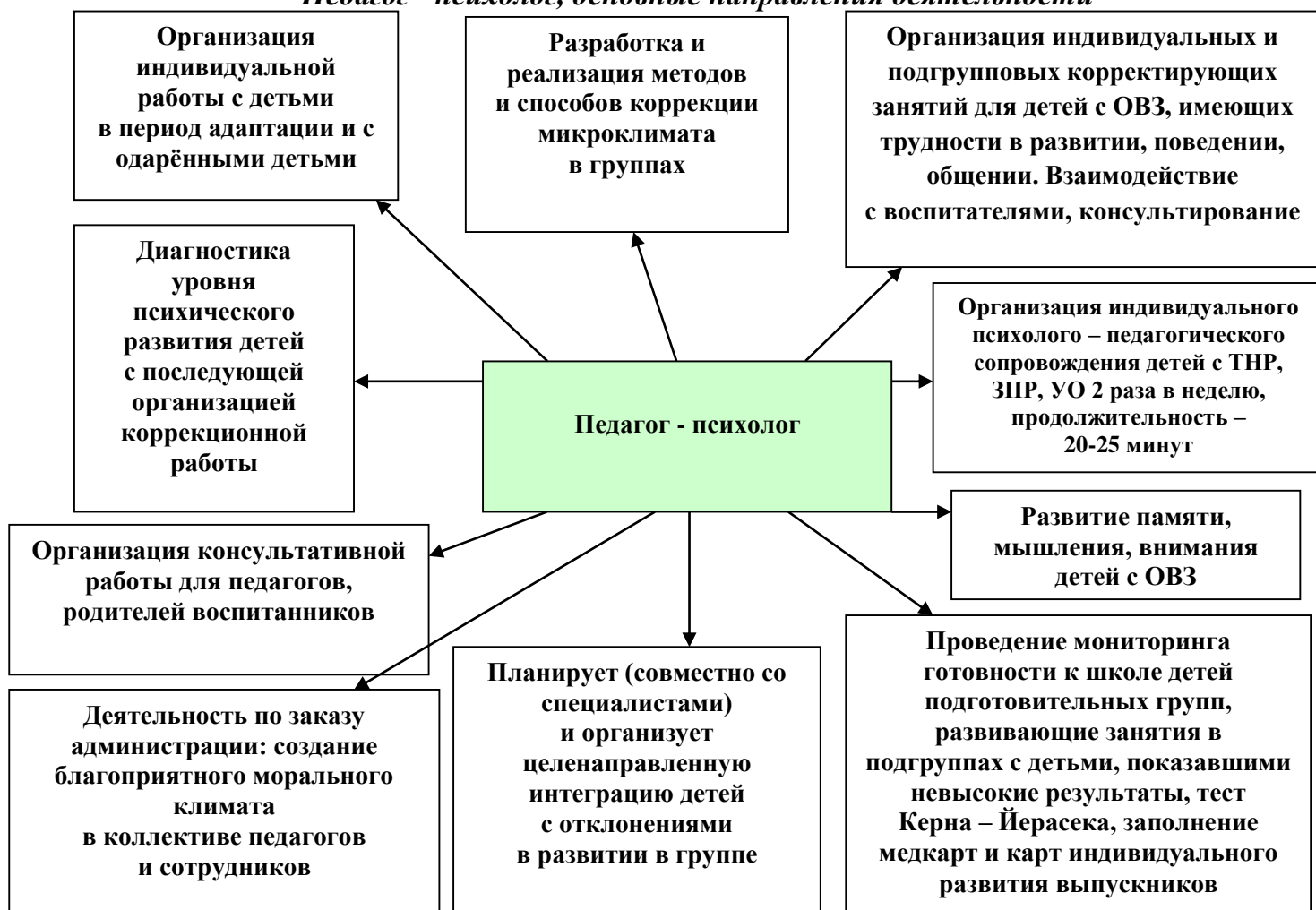
Рис. 2 «Педагог - психолог, основные направления деятельности»