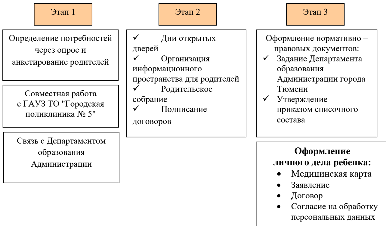
Рис. 3. «Этапы организации детей КМП»

С целью изучения степени удовлетворенности родителей качеством образовательных услуг консультационно – методического пункта, предоставляемых дошкольным образовательным учреждением, условиями пребывания их детей в детском саду, с целью выявления мнения родителей о получении образовательных услуг, а также возможные пожелания предусмотрено проведение социологического исследования удовлетворенности родителей качеством услуг консультационно – методического пункта, предоставляемых образовательным учреждением в периодичности 1 раз в квартал средствами анкетирования.